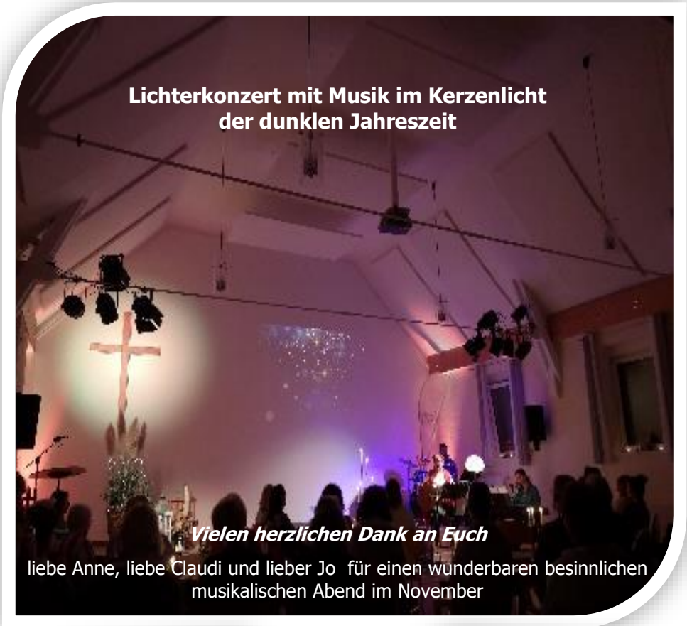
Lichterkonzert mit Musik im Kerzenlicht der dunklen Jahreszeit